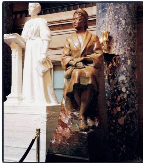
Rosa PARKS Capitole/Capitool 2013

Op 13.11.1956 verbreekt het hoogerechtshof van de Verenigde Staten de segregatiewetten in de bussen en verklaart ze ongrondwettelijk. Maar het is pas in 1964 dat ze worden opgeheven. Rosa Parks militeert haar leven lang voor raciale gelijkheid.